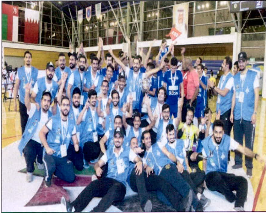
• فرحة أبناء التطبيق بعد التوقيع بالدورة

كرة الطاولة فوز جامعة جدو بالمركز الأول والتطبيق التطبيقي والتدريب في المركز الثاني وقد اعرب رئيس اللجنة المنظمة وعميد شؤون الطلبة الدكتور حسين المكيمي عن سعادته لنجاح الدورة والعرس الرياضي والاجتماعي الذي شهدته ملاعب الهيئة والكويت واضاف ان الدورة حققت النجاح قبل انطلاقها نتيجة رعاية سمو رئيس مجلس الوزراء الشيخ جابر المبارك لها ومشاركة وزرات الكويت في الحدث وتوقيع كافة الامكانيات لنجاح التجمع الشبابي للائقاء من دول مجلس التعاون الذين استقبلتهم العين قبل الدار. وتحققت العديد من الاهداف الراقدة التي بناها بها صاحب السمو امير البلاد المعفي حكيم الامة وسمو ولي العهد بامعية ثلاثي الاشقاء وشباب الخبرات والتعارف. و اضاف ان الدورة شهدت مستويات طيبة من نجوم الرياضة الجامعية والتطبيق العالي وشارك برئيس اللجنة المنظمة العليا علي فهد العصف وجميع اعضاء اللجنة العليا ومحمد حمد النويجري ممثل الأمانة العامة وضيوف الكويت واللجان العاملة وخاصة لجنة المنظومين الذين كانوا نموذجاً مشرفاً للكويت وكسباً للمشاركة في البطولات والدورات وبخاصة ابنائي واخواني من جامعات دول مجلس التعاون بكلمة مختصرة لا اقول فيها وداعا وإنما إلى اللقاء في الدورة التاسعة وتكرراً لكل من ساهم في النجاح